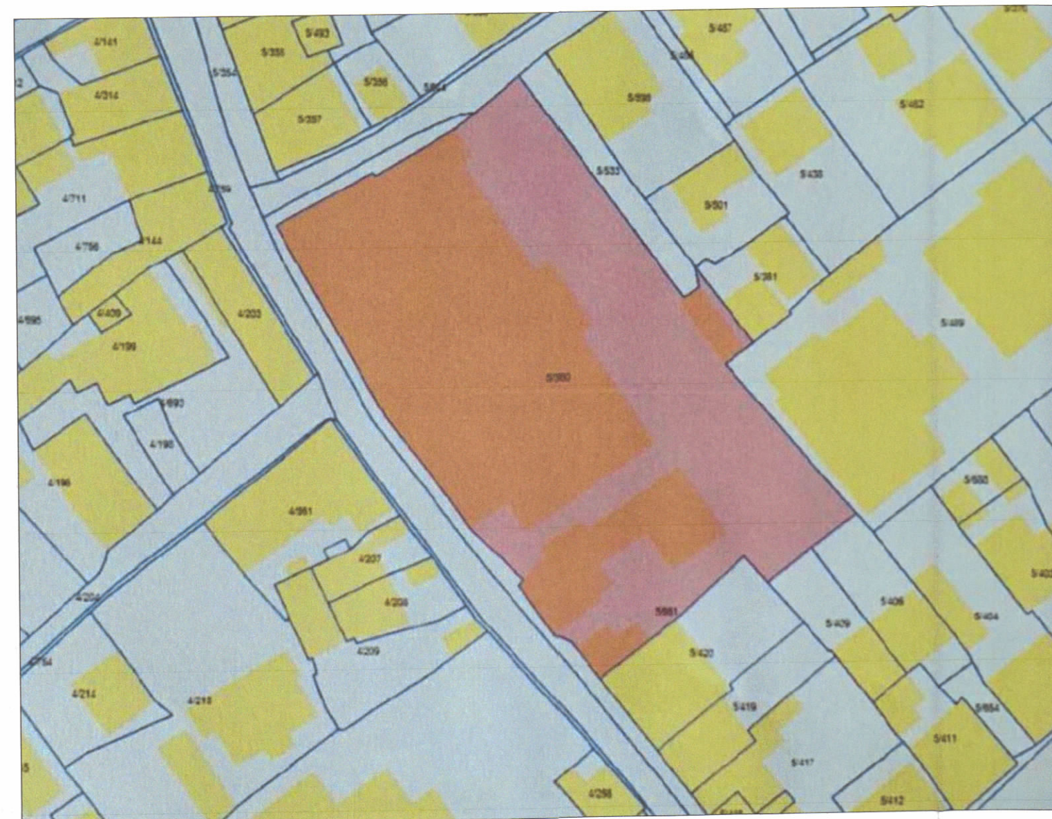
POZICIONI KADASTRAL SHK. 1:500