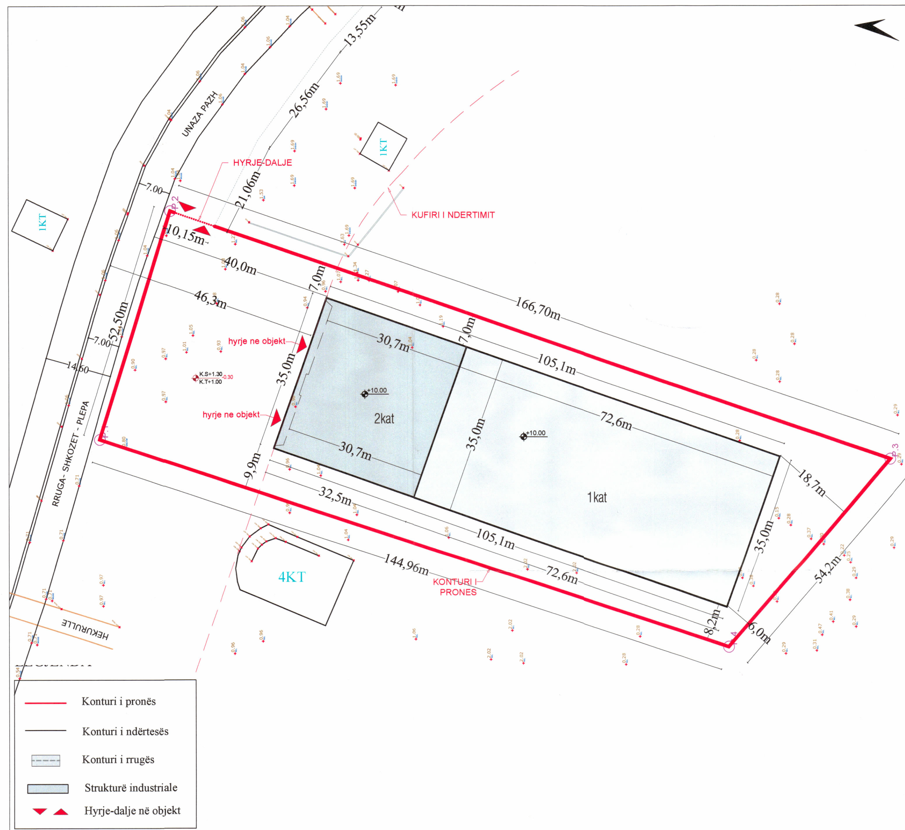
PLANI I VENDOSJES SË STRUKTURËS SHK. 1:500