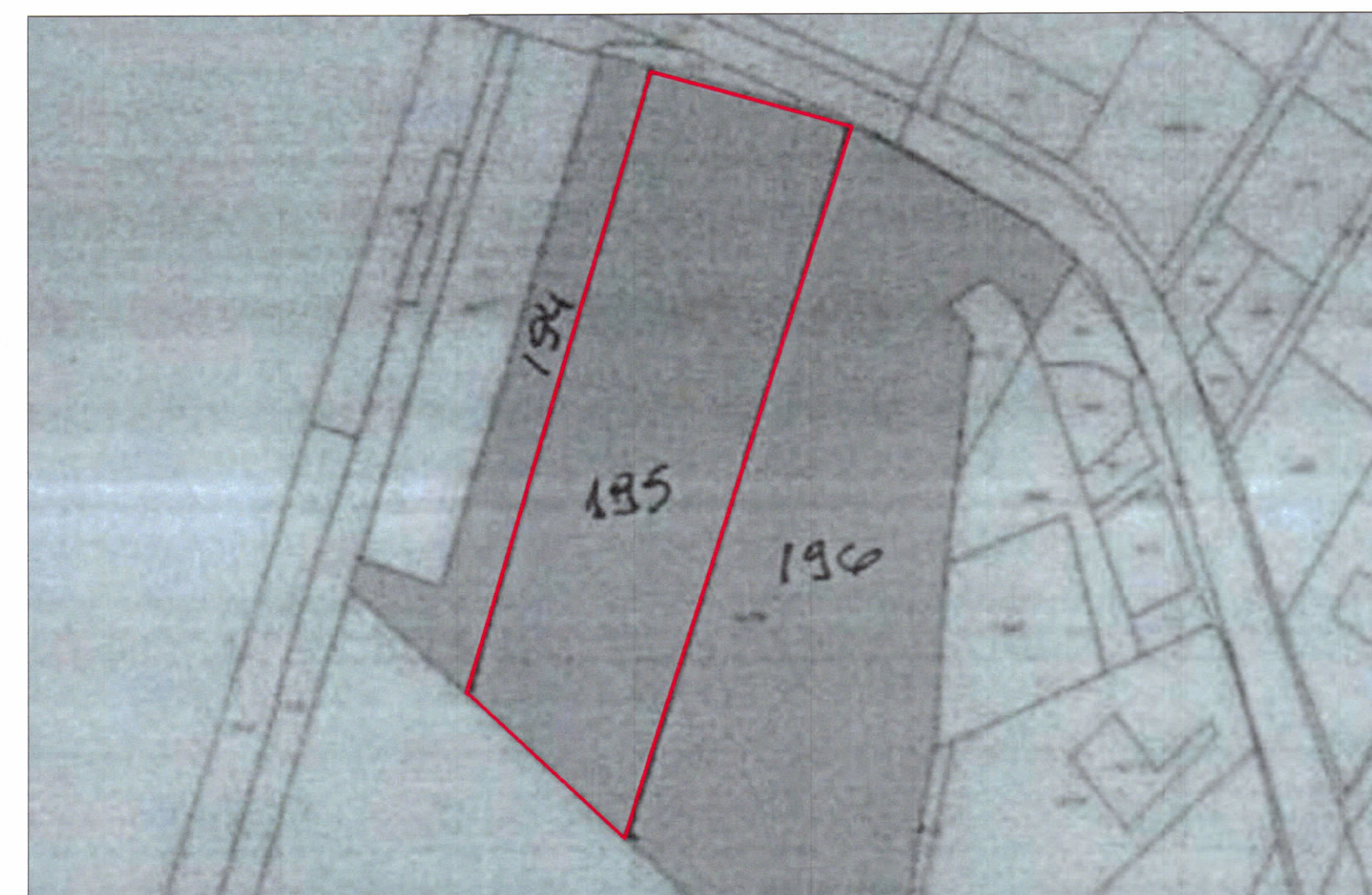
POZICIONI KADASTRAL SHK. 1:1500