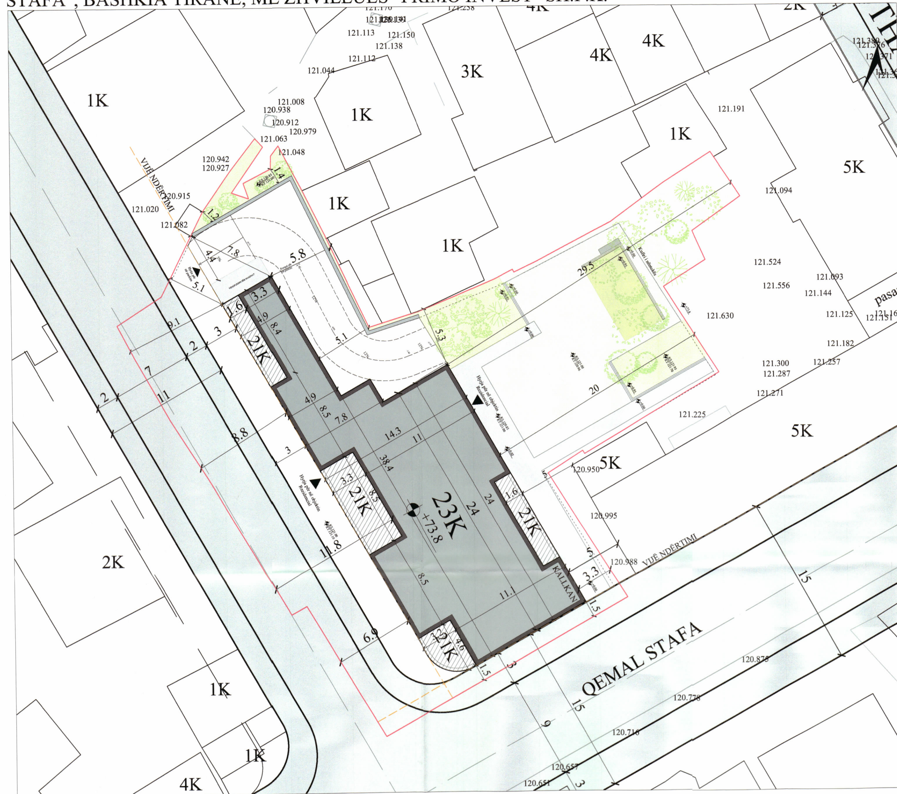
PLANI I VENDOSJES SË STRUKTURËS SHK. 1:200