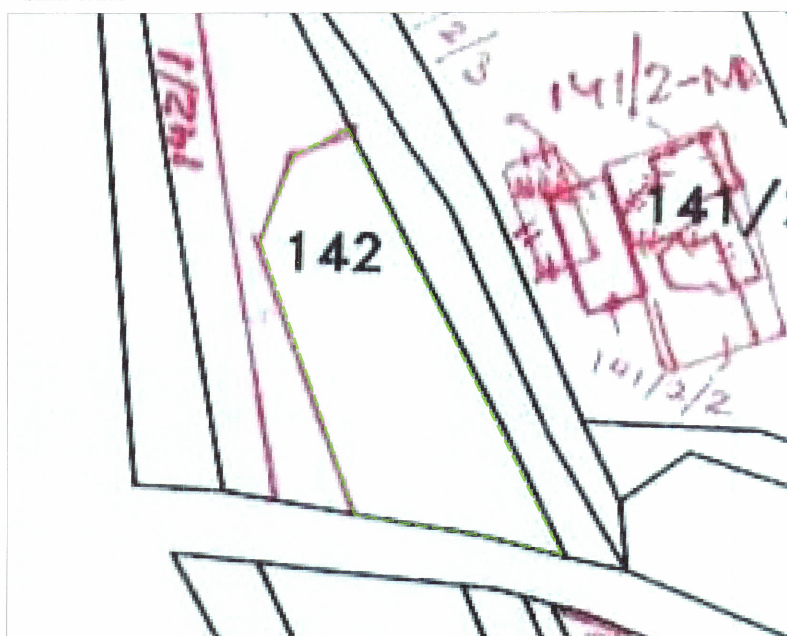
POZICIONI KADASTRAL SHK. 1:500