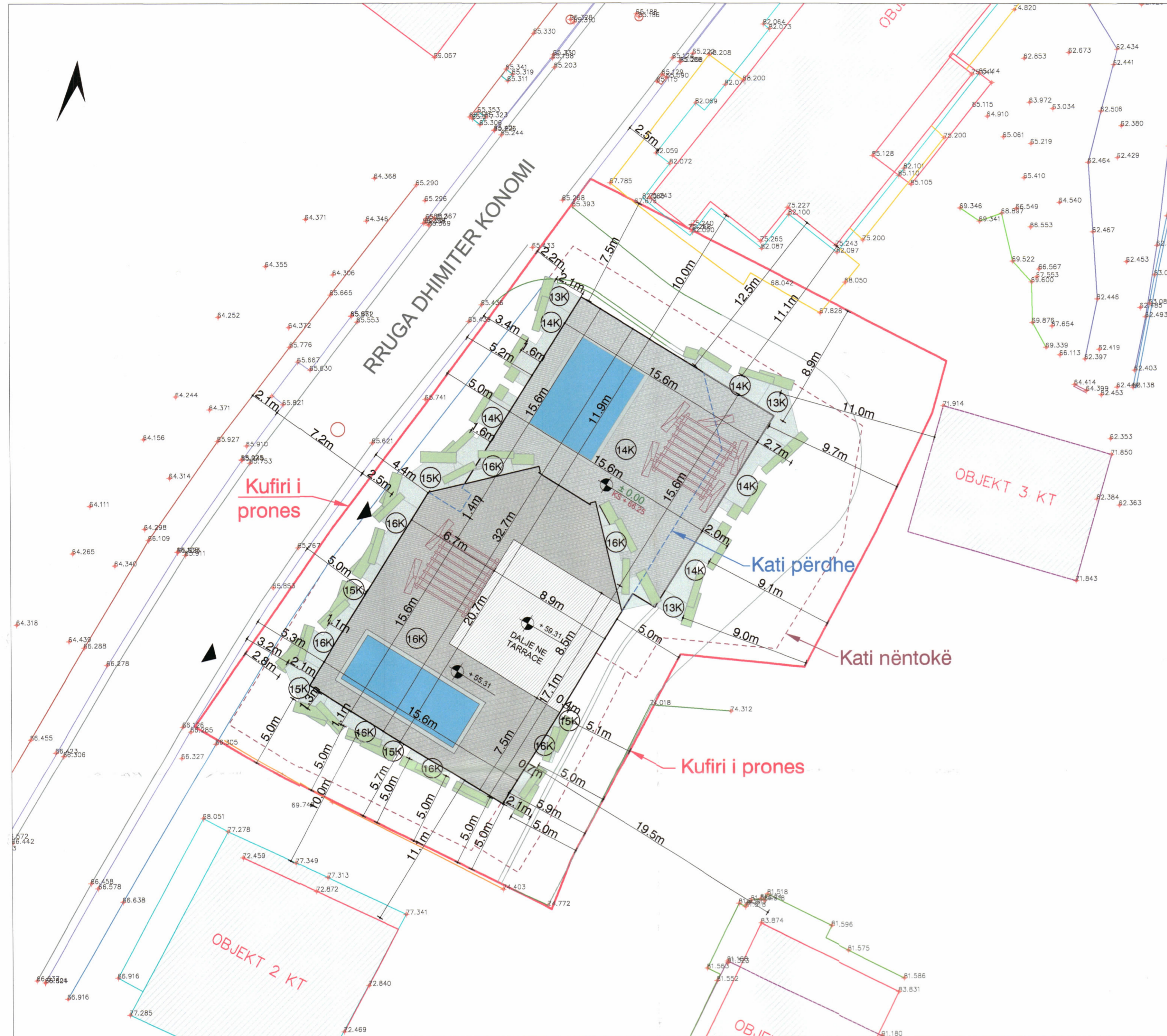
PLANI I VENDOSJES SË STRUKTURËS SHK. 1: 200