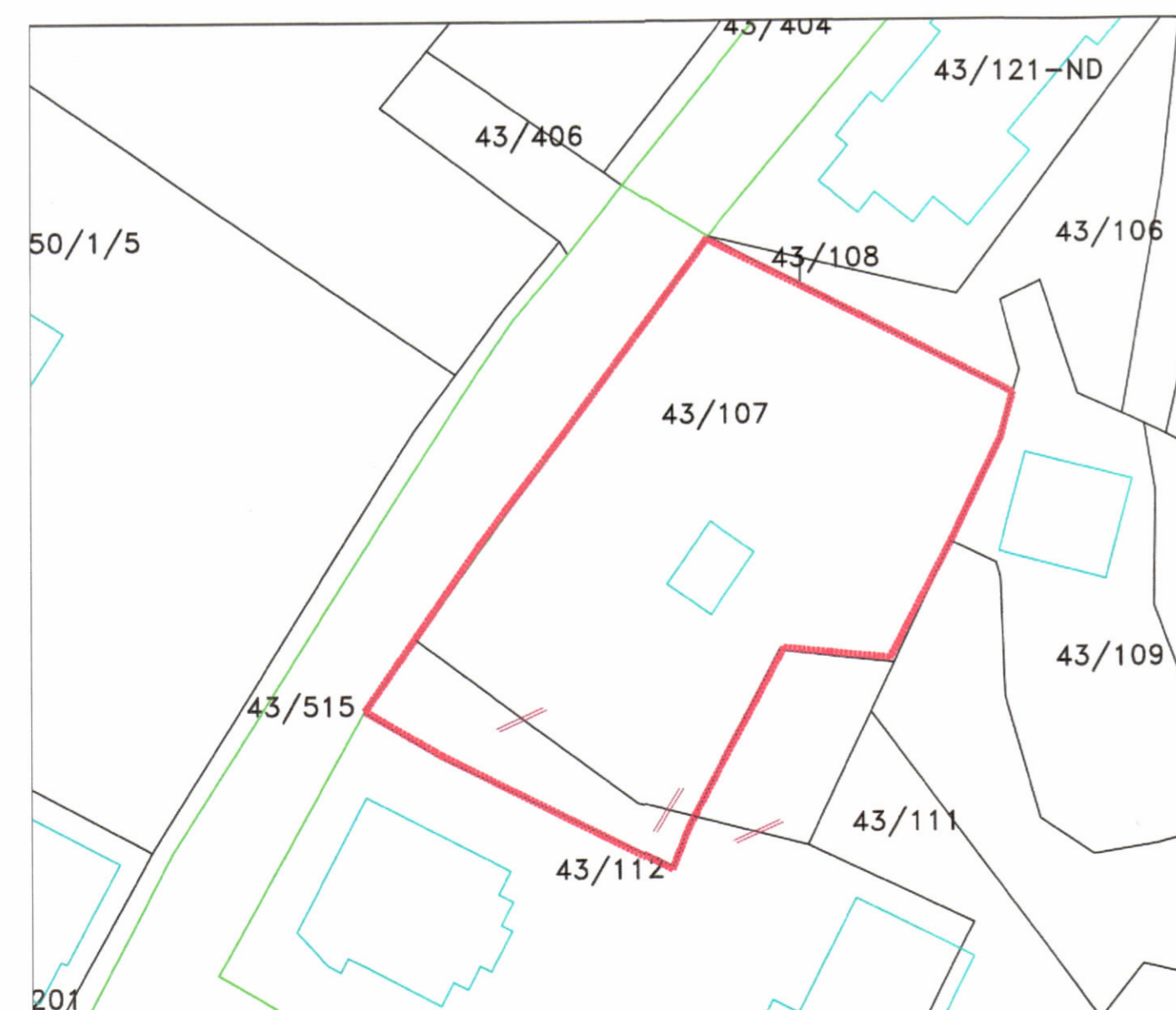
POZICIONI KADASTRAL SHK. 1:500