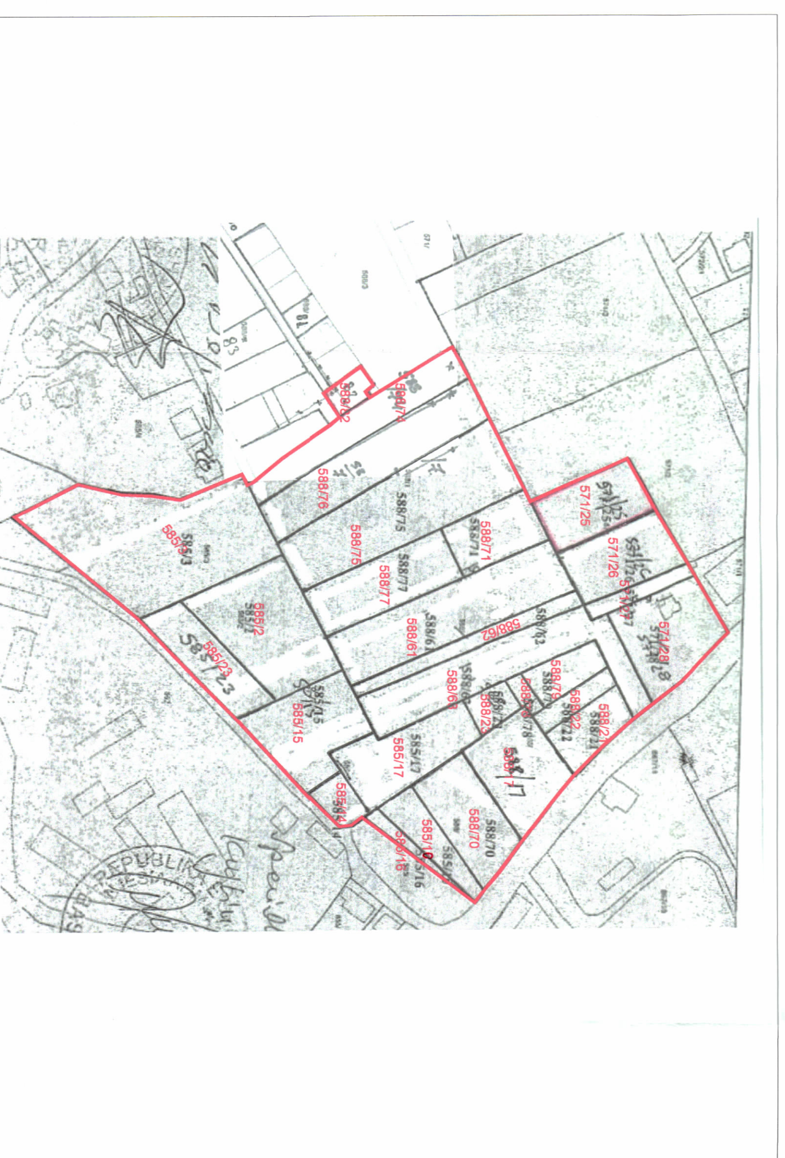
POZICIONI KADASTRAL SHK. 1:2000