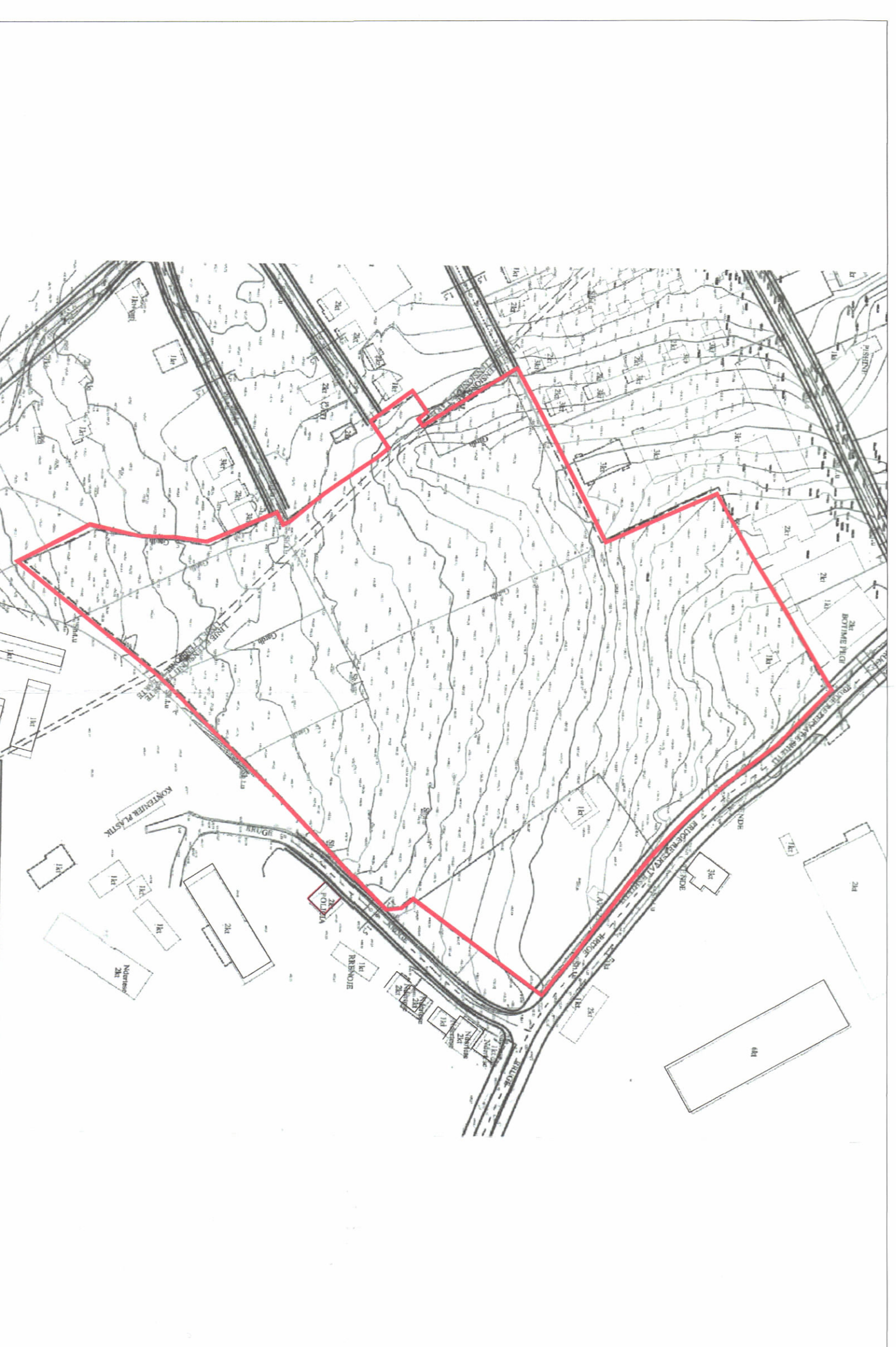
HARTA TOPOGRAFIKE SHK. 1:2000