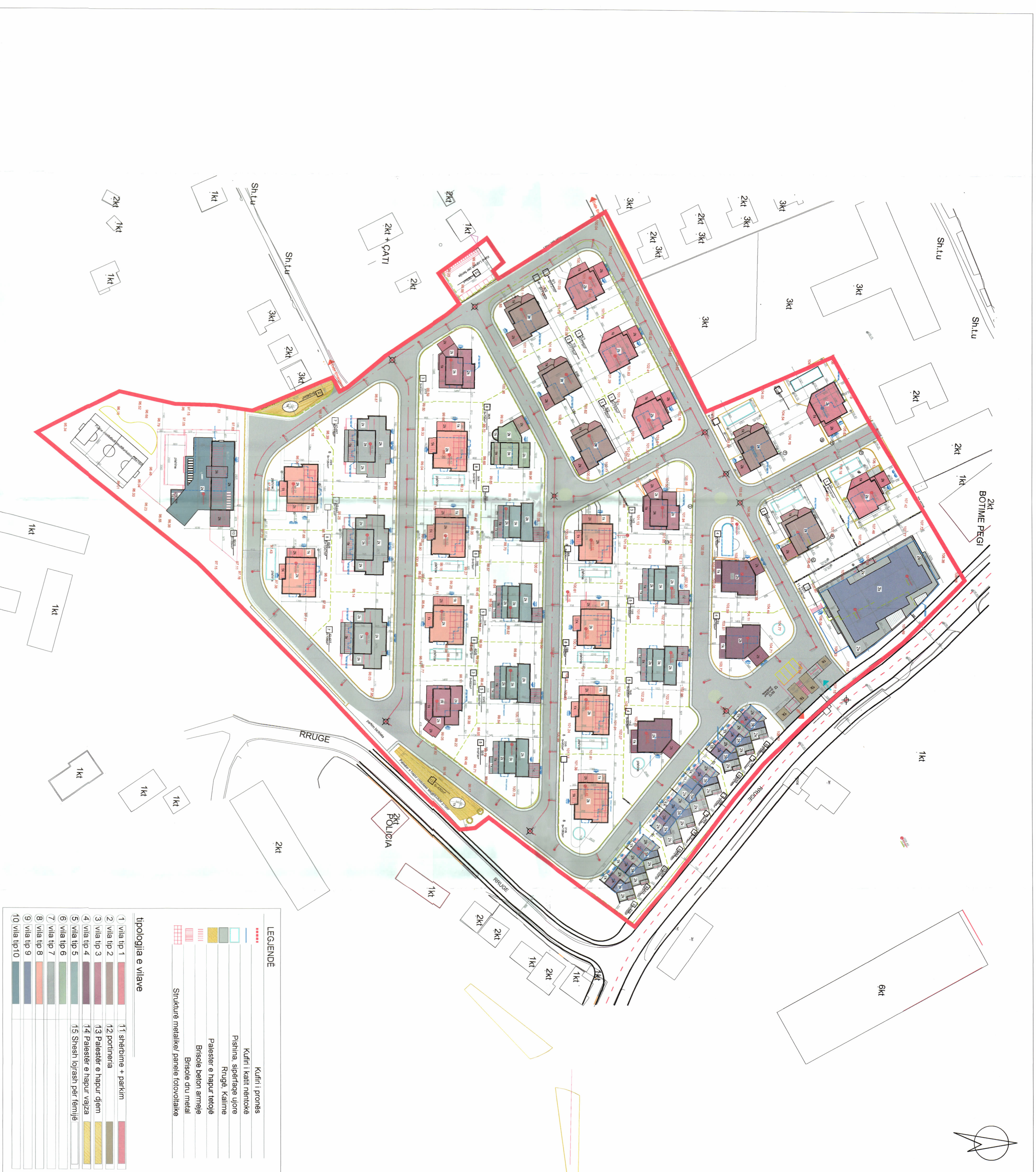
PLANI I VENDOSJES SË STRUKTURËS SHK. 1: 750