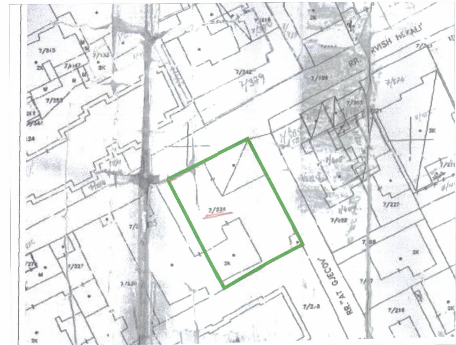
POZICIONI KADASTRAL SHK. 1:500