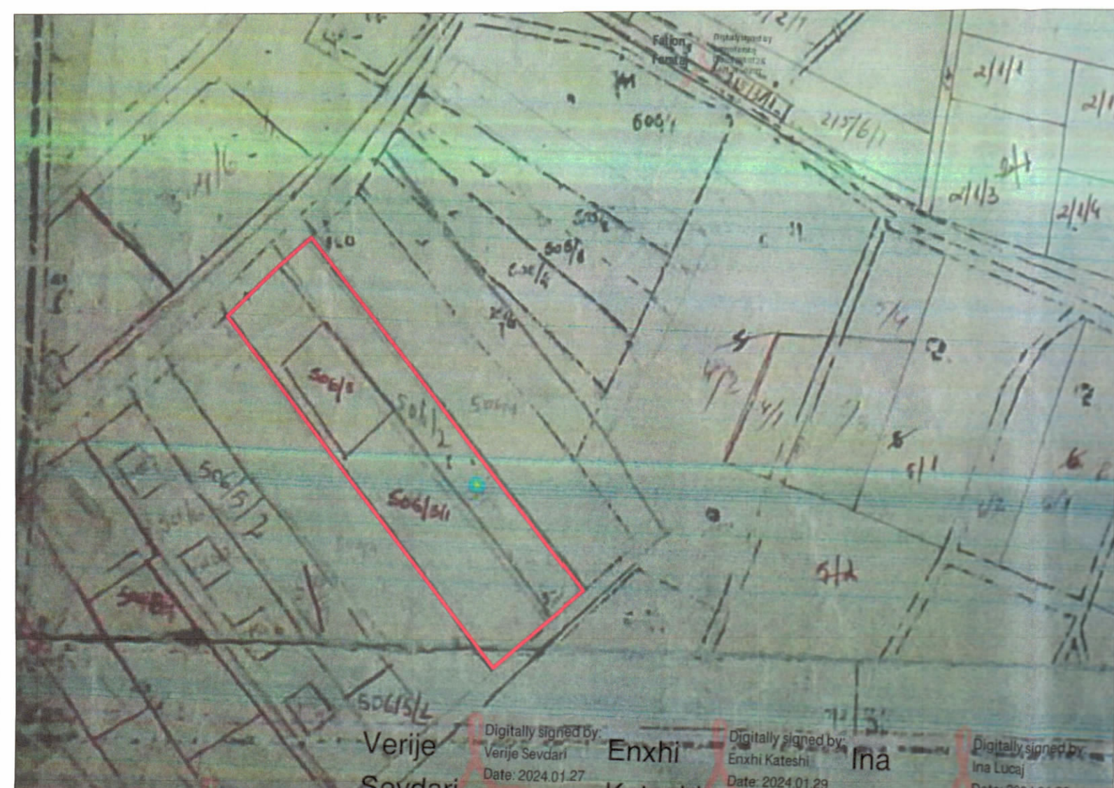
POZICIONI KADASTRAL SHK. 1:2000