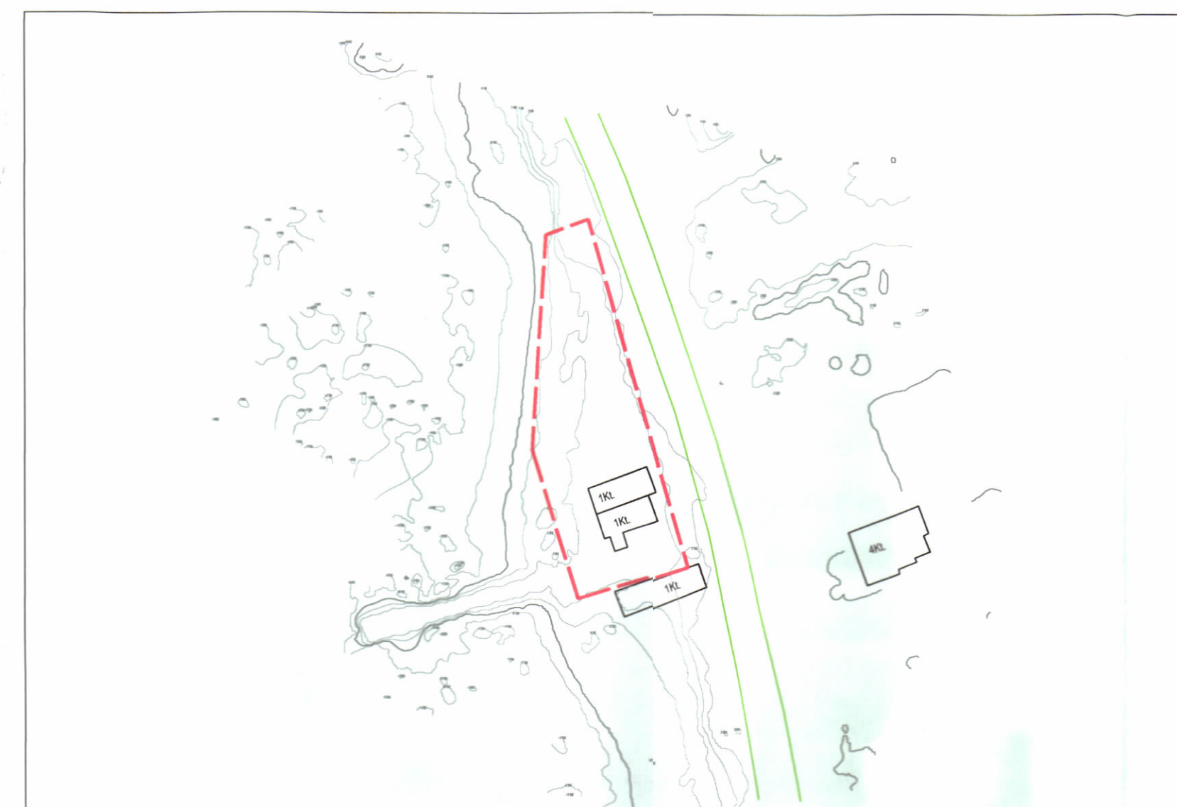
HARTA TOPOGRAFIKE SHK. 1:500