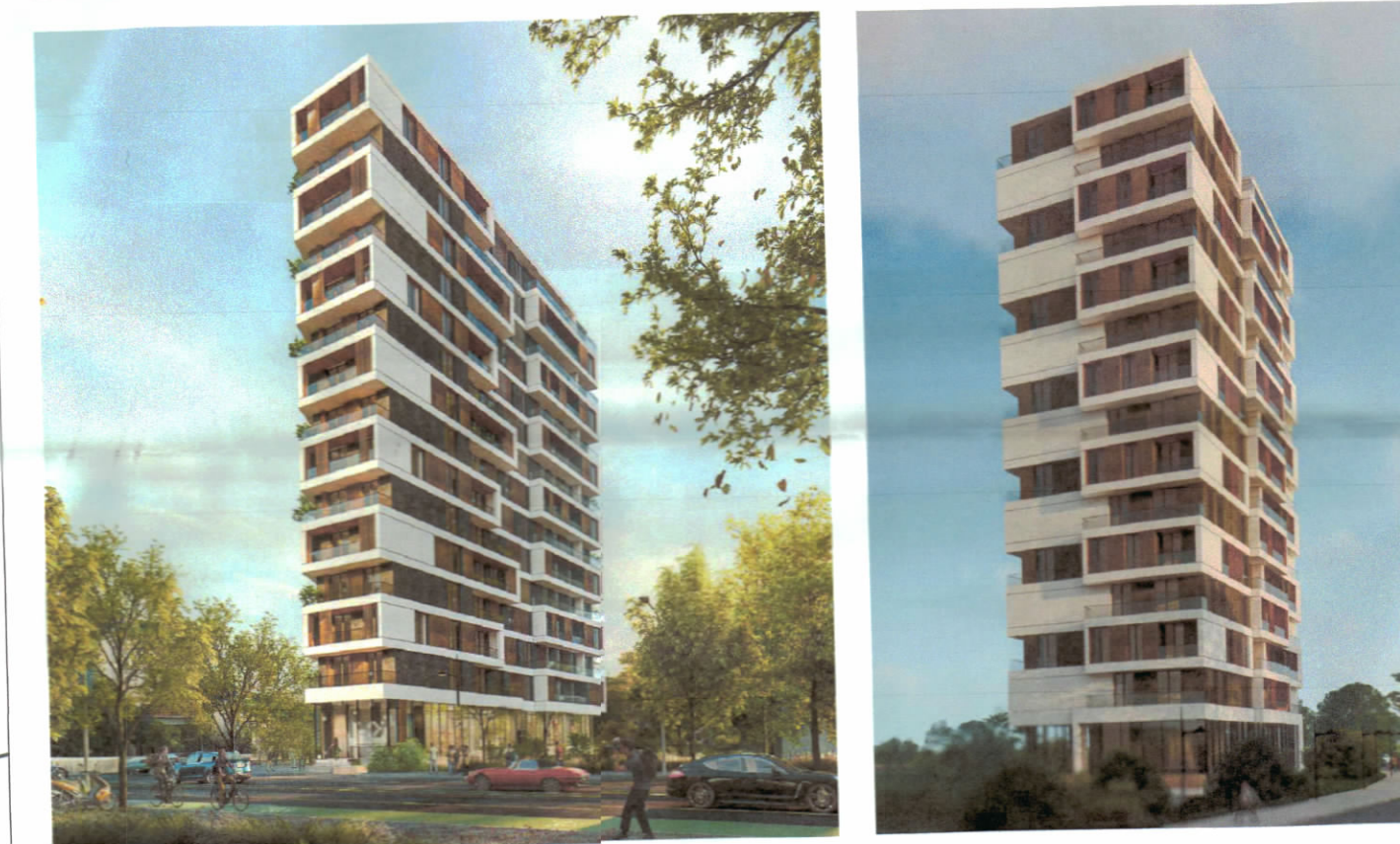
PAMJE 3 DIMENSIONALE