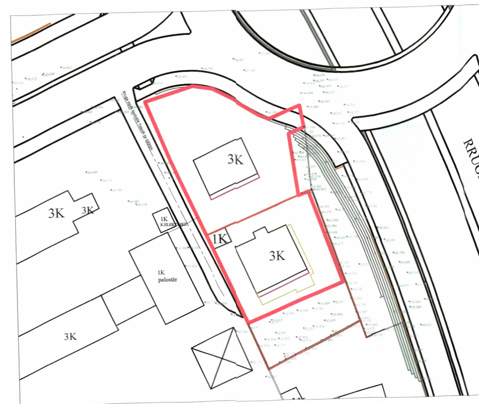
HARTA TOPOGRAFIKE SHK. 1:500