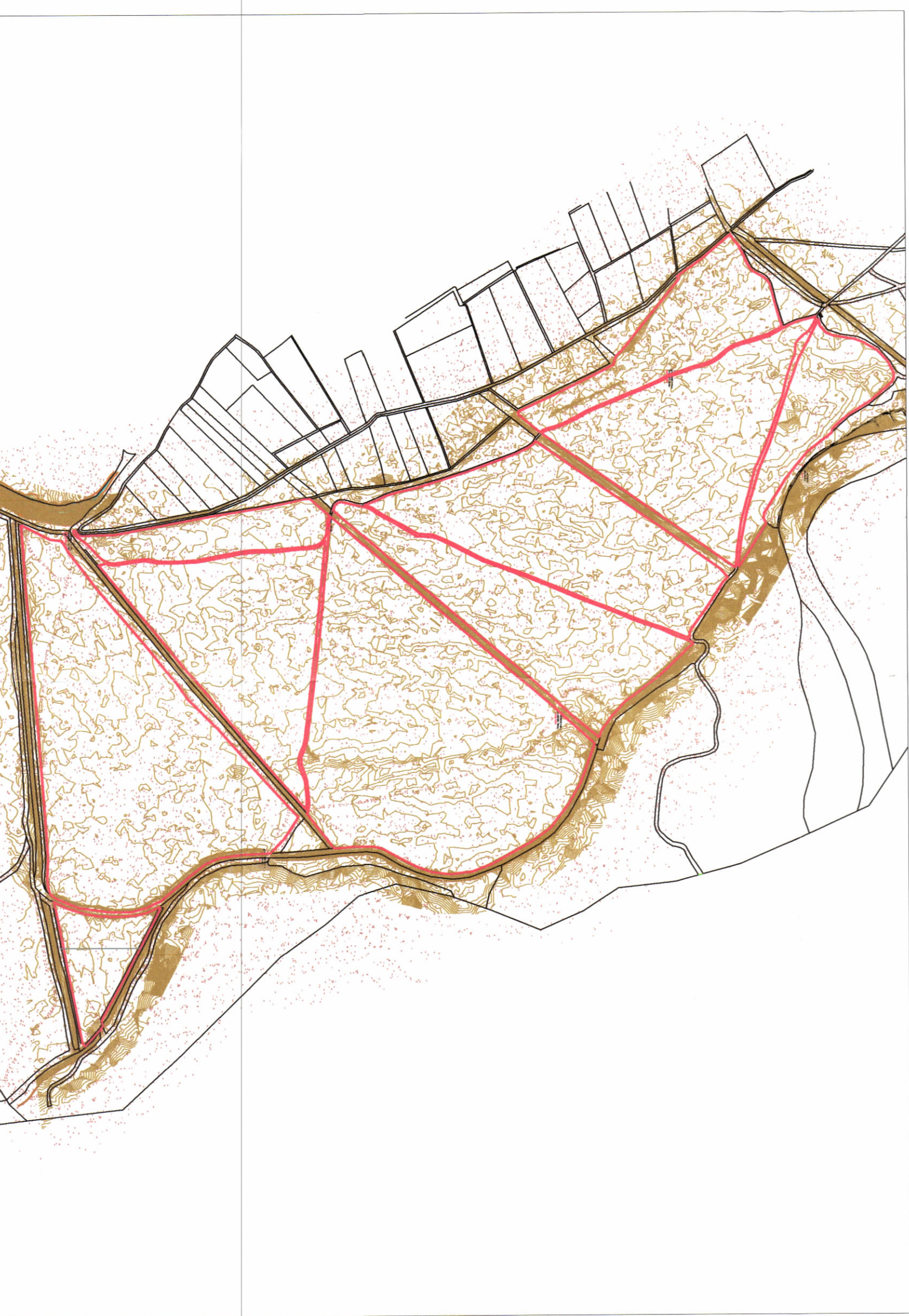
HARTA TOPOGRAFIKE SHK. 1:5000