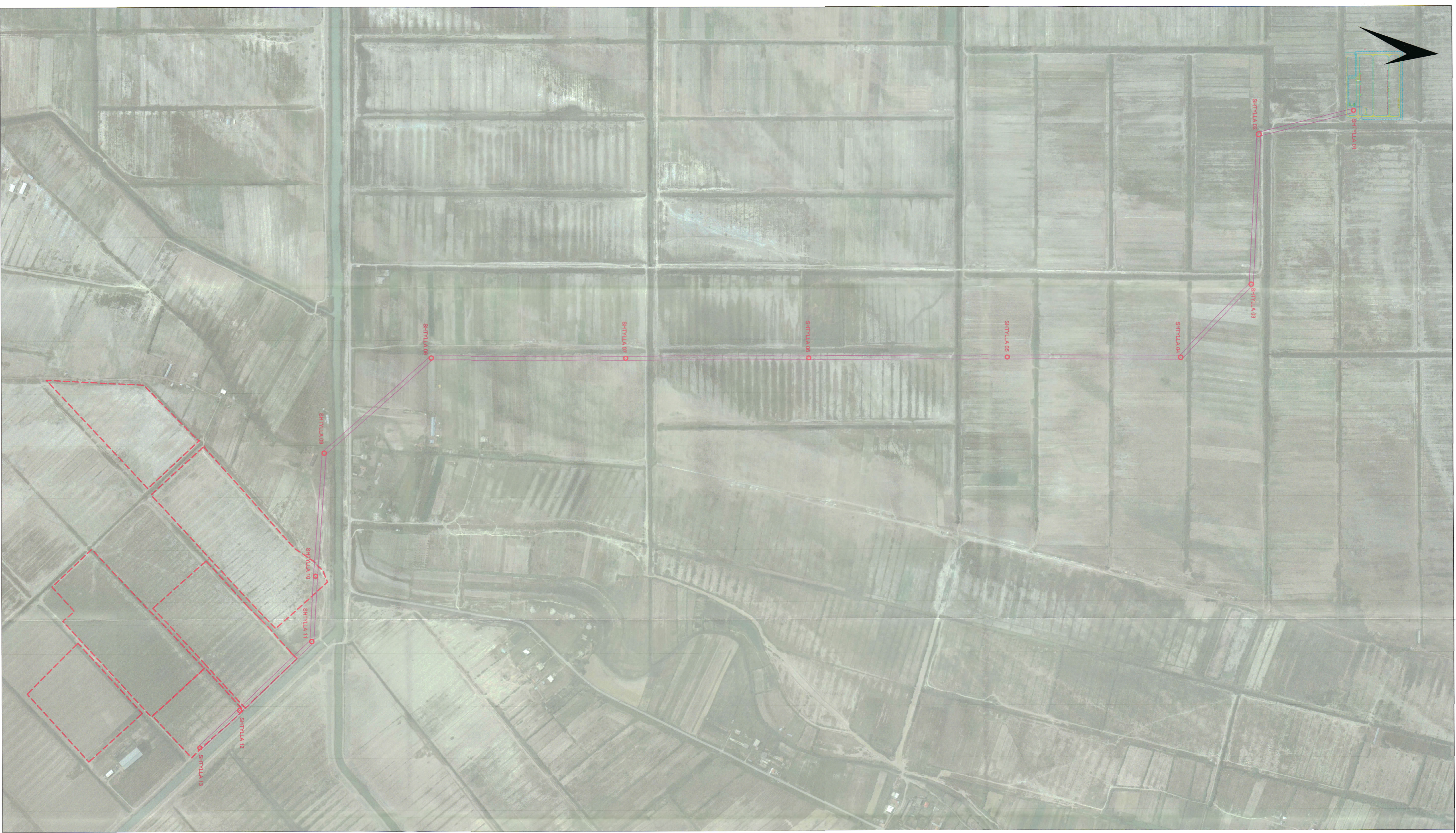
PLANI I VENDOSJES SË STRUKTURËS