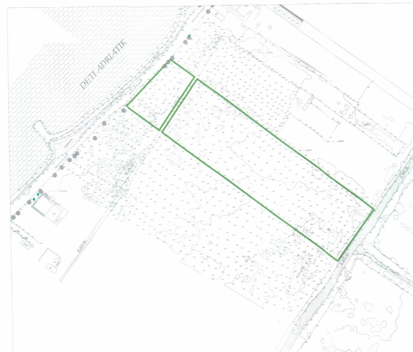
HARTA TOPOGRAFIKE SHK. 1:500