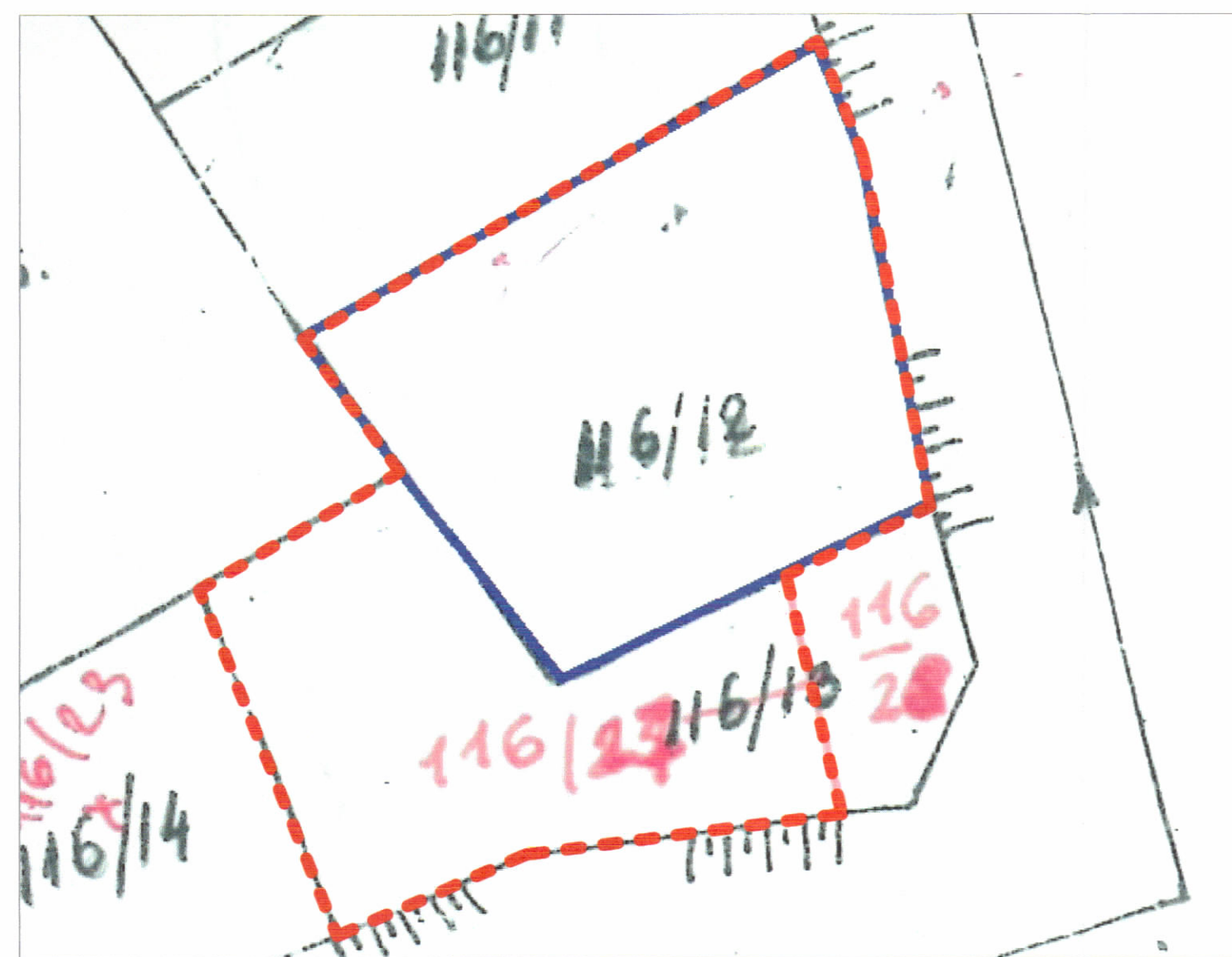
POZICIONI KADASTRAL SHK. 1:700