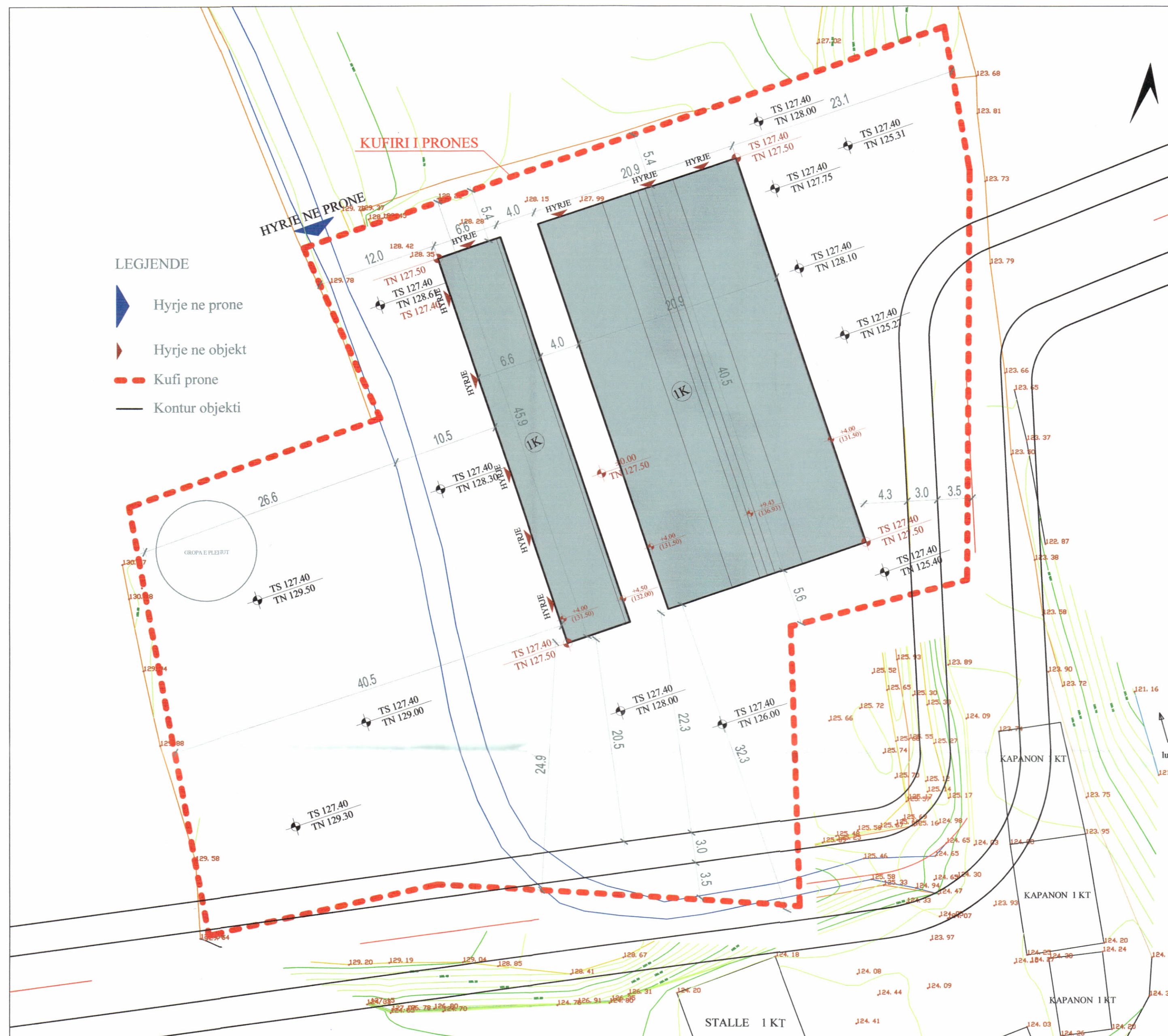
PLANI I VENDOSJES SË STRUKTURËS SHK. 1:300