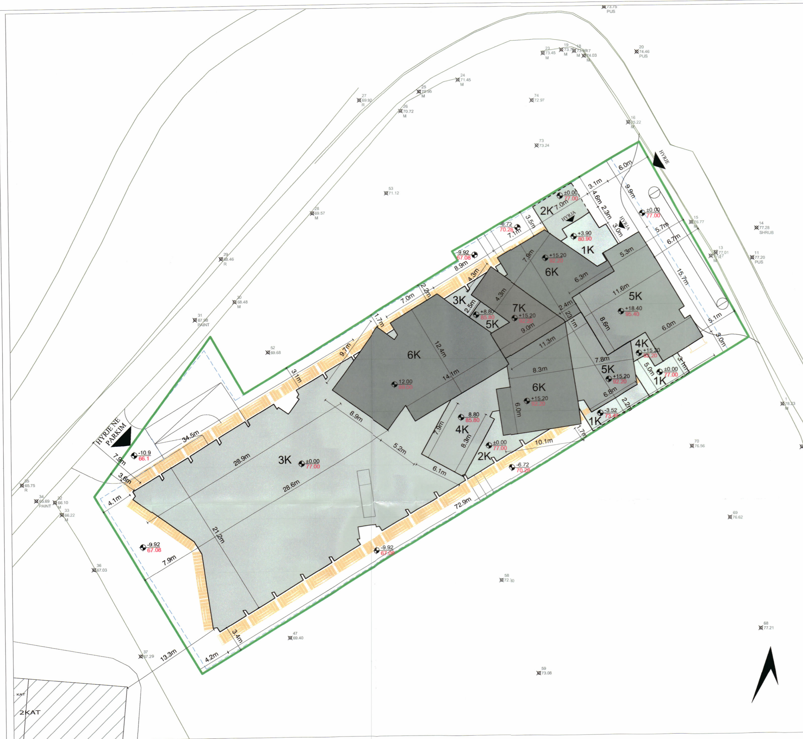
PLANI I VENDOSJES SË STRUKTURËS SHK. 1:250