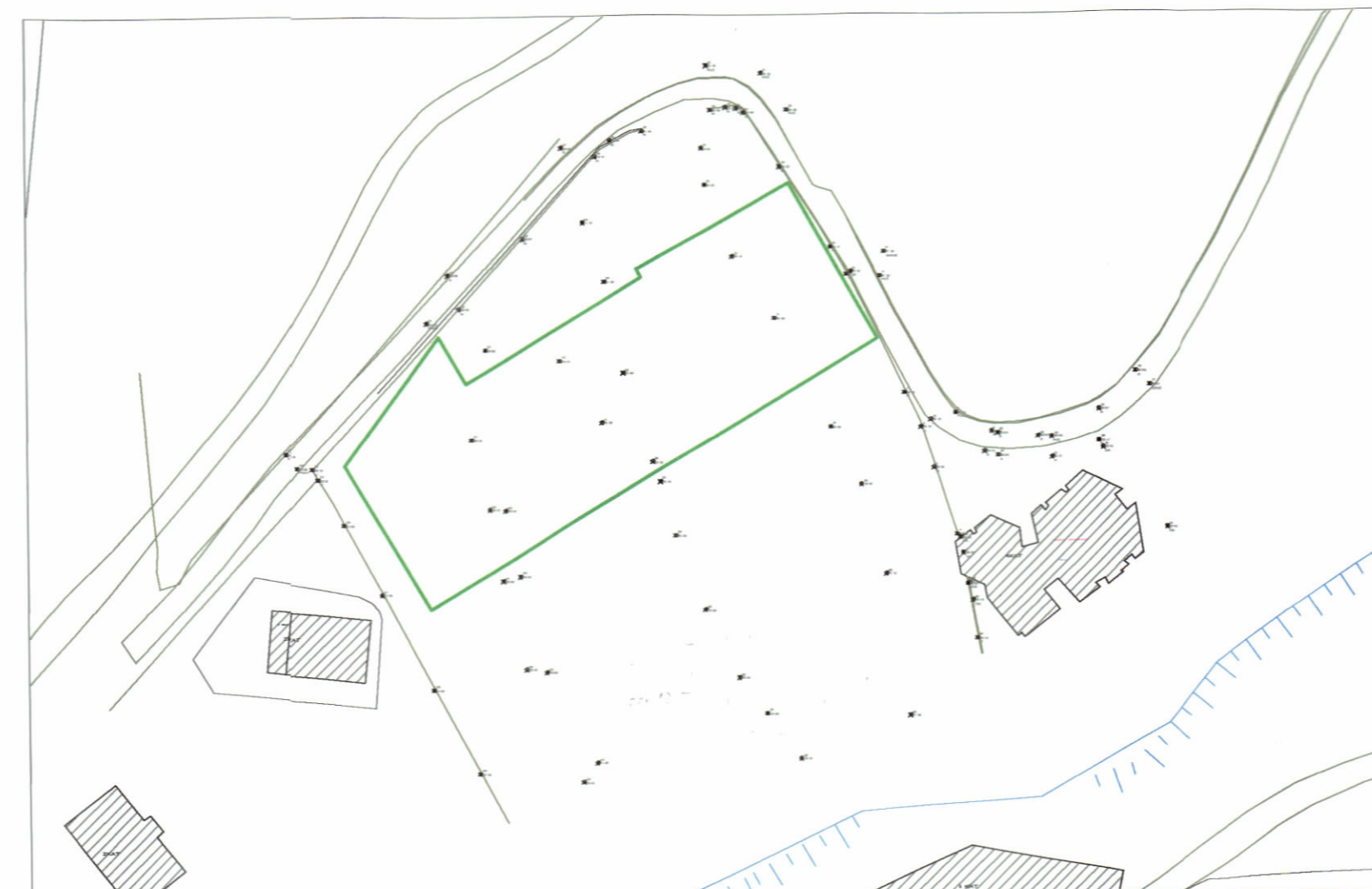
AZHORNIMI TOPOGRAFIK SHK. 1:1000